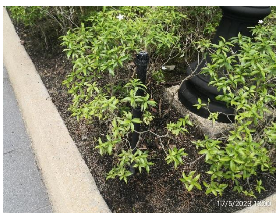
รูปที่ 2-8 น้ำทิ้งสุดท้ายไปใช้ประโยชน์ให้ต้นไม้ในพื้นที่สีเขียว