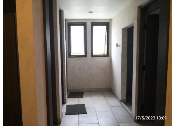
รูปที่ 2-23 ห้องน้ำ ห้องส้วม ในอาคารสรว่ายน้ำ