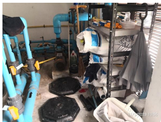
การใช้สารเคมี (เกลือ) และการจัดเก็บอย่างมิดชิดในที่ที่เหมาะสมและเป็นระเบียบ