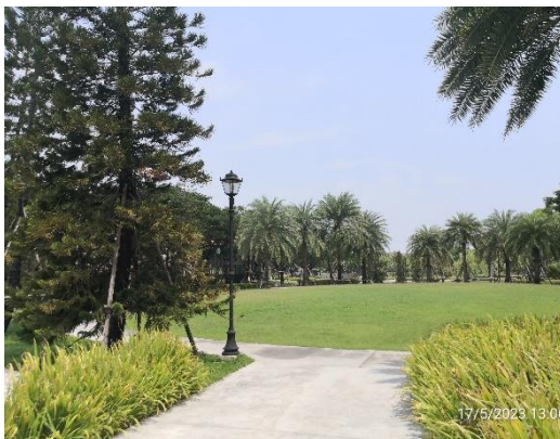
รูปที่ 2-3 การปลูกไม้ยืนต้นชนิดต่างๆ ภายในโครงการ