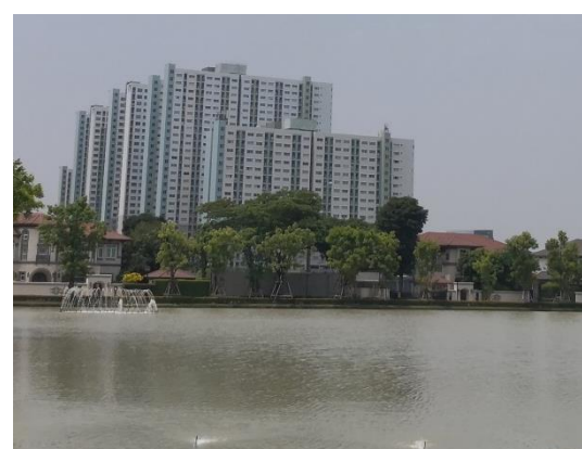
รูปที่ 2-14 ป่อน้ำของโครงการ