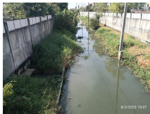
รูปที่ 2-7 ระยะถอยร่นจากแนวเขตคลอง