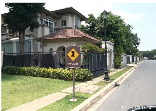
ป้ายจำกัดความเร็ว