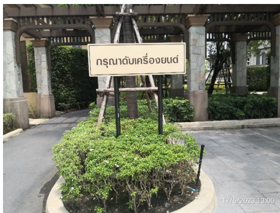
รูปที่ 2-1 ป้ายดับเครื่องยนต์บริเวณที่จอดรถ