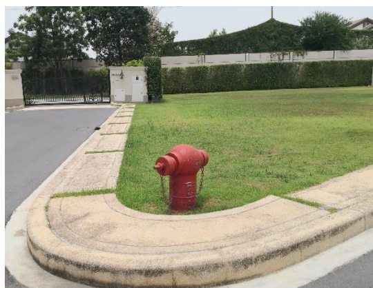
รูปที่ 2-16 ระบบน้ำดับเพลิง