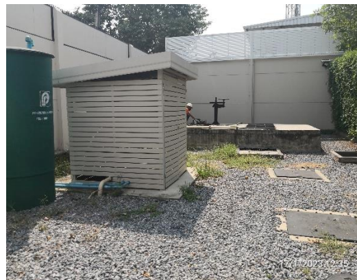
ระบบบำบัดน้ำเสียรวม 2