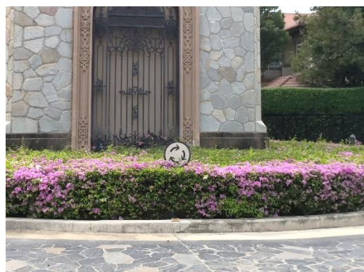
ป้ายเตือนวงเวียน