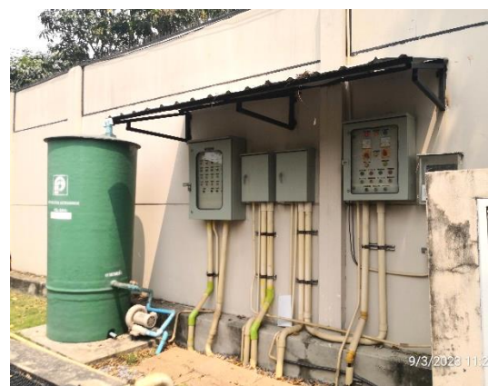
รูปที่ 2-13 ถังดักละอองฝอย