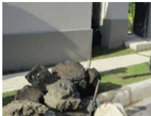
รูปที่ 2-15 การขุดลอกคลองหลวงแพ่ง และบริเวณพื้นที่โครงการก่อนถึงช่วงฤดูฝน